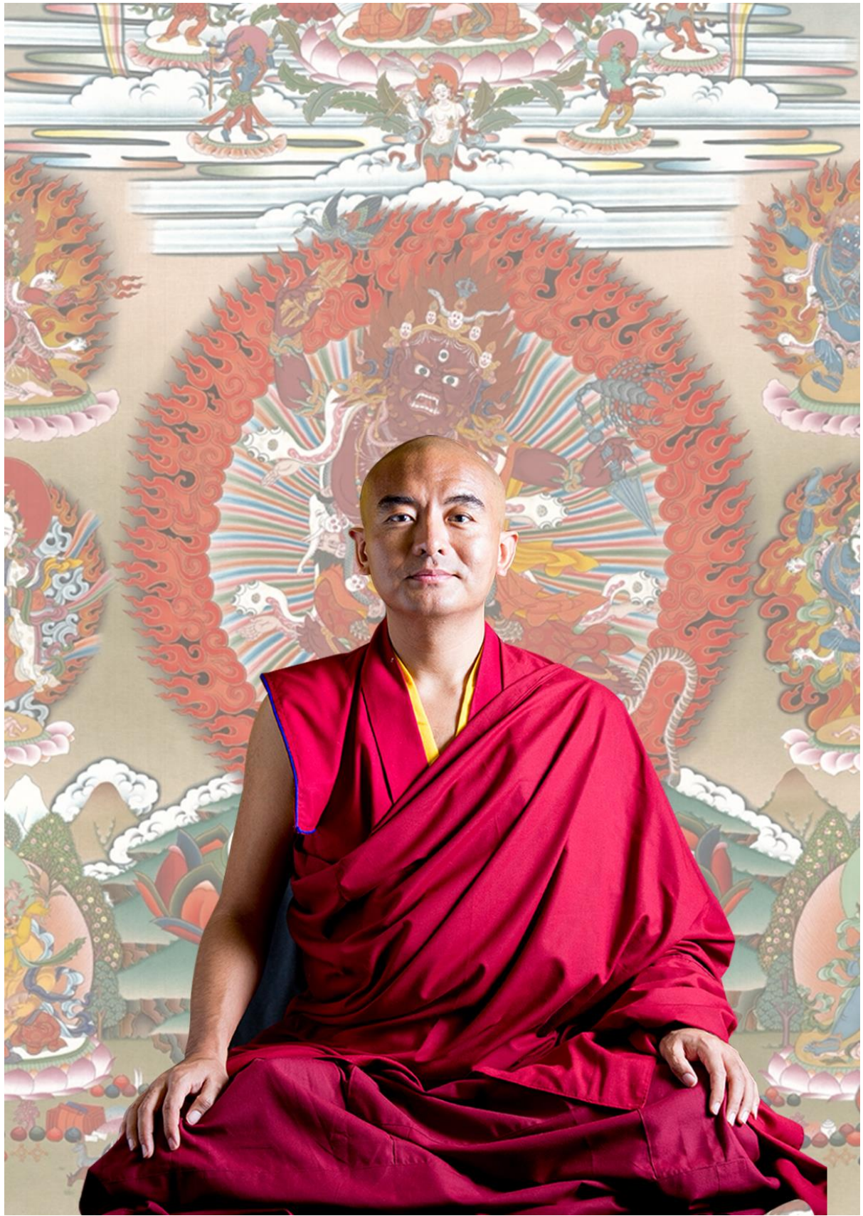
尊貴的第七世詠給·明就仁波切